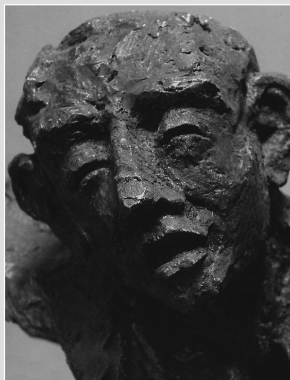
Crocifisso , particolare, gesso patinato.