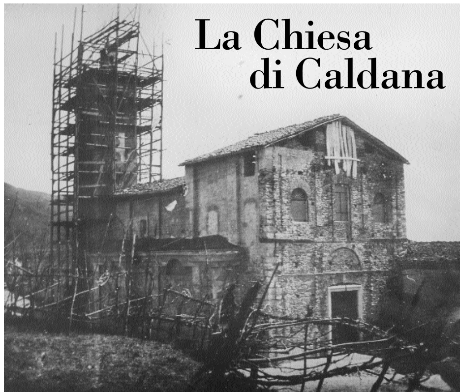
La chiesa a Carnisio, 1899 (a destra le stalle non ancora abbattute)