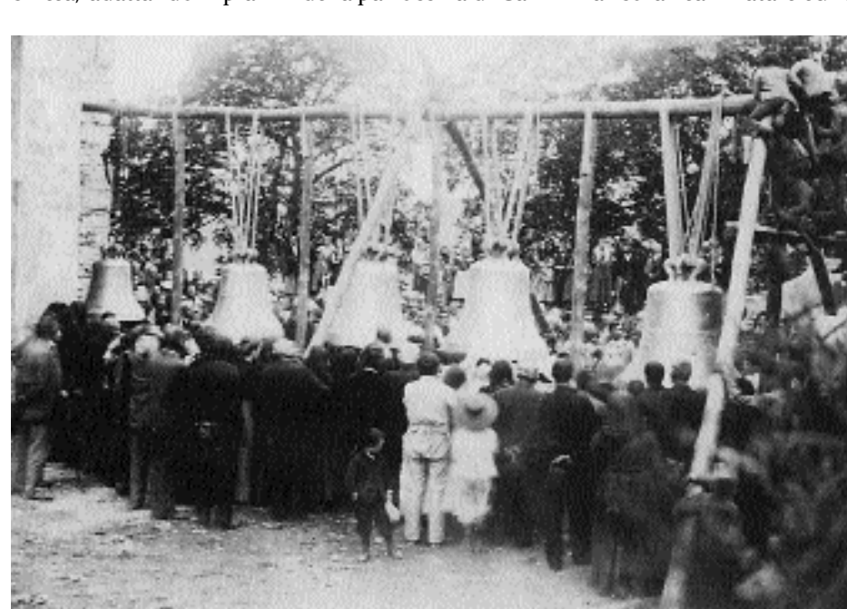
La posa delle campane, 1900

In seguito pausa: fino al 1899, quando si fece il pavimento a gradinate davanti al portone della chiesa, adattando il piazzale con muri di contenimento.