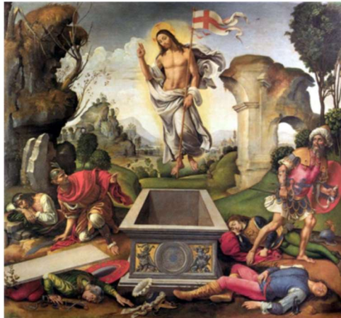
RAFFAELLINO DEL GARBO, Resurrezione, 1510

Tardi ti ho amato, bellezza così antica e così nuova, tardi ti ho amato. Tu eri dentro di me, e io fuori. E là ti cercavo. Deforme, mi gettavo sulle belle forme delle tue creature. Tu eri con me, ma io non ero con te. Mi tenevano lontano da te quelle creature che non esisterebbero se non esistessero in te. Mi hai chiamato, e il tuo grido ha squarciato la mia sordità. Hai mandato un baleno, e il tuo splendore ha dissipato la mia cecità. Hai effuso il tuo profumo; l'ho aspirato e ora anelo a te. Ti ho gustato, e ora ho fame e sete di te. Mi hai toccato, e ora ardo dal desiderio della tua pace.