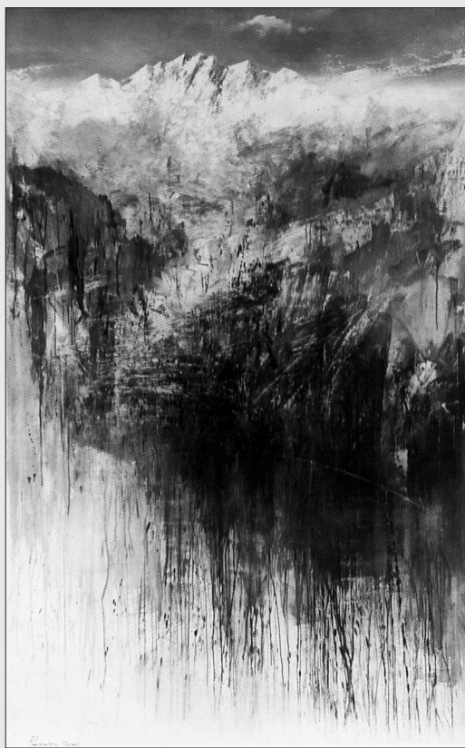
Antonio Pedretti - Arcumeggia, affresco.