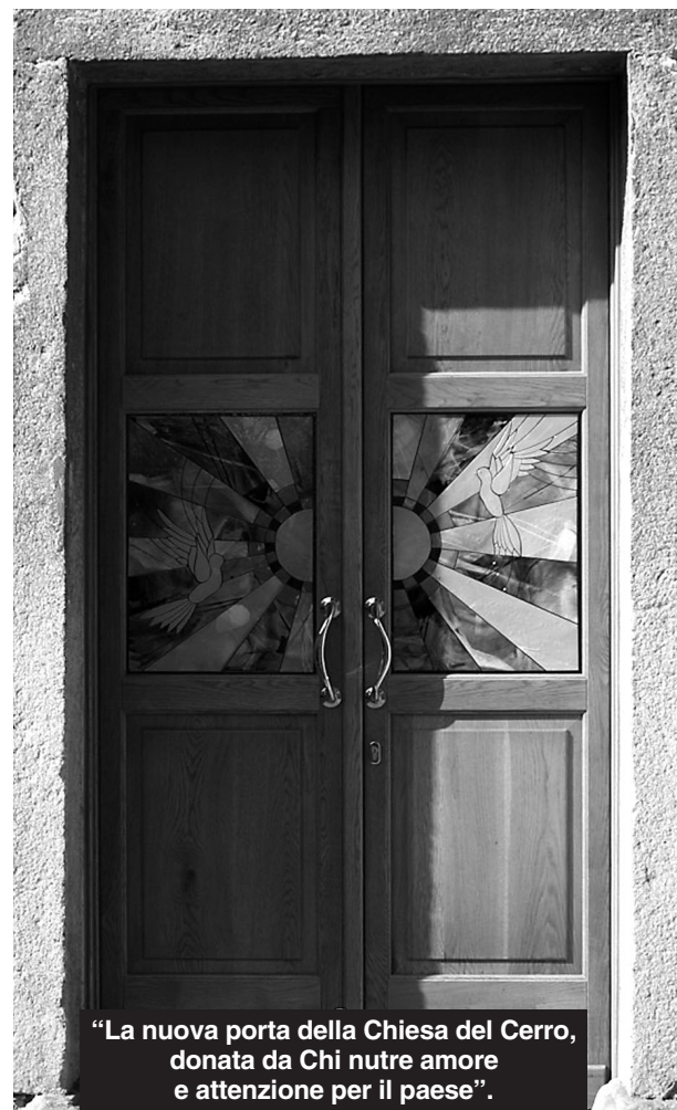
"La nuova porta della Chiesa del Cerro, donata da Chi nutre amore e attenzione per il paese".