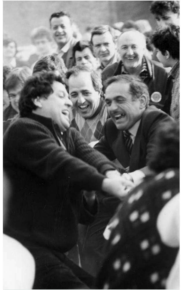
Renato Pozzetto Pippo Cassarà e Gianni Picconi al tiro alla fune.